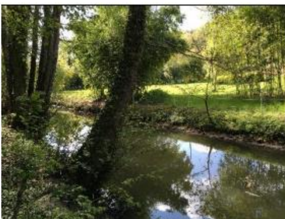
La Guesle à Hermeray (gauche) et la Guéville à St-Hilarion (droite)