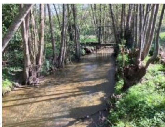
La Drouette à Villiers-le-Morhier (gauche) et à Orcemont (droite)